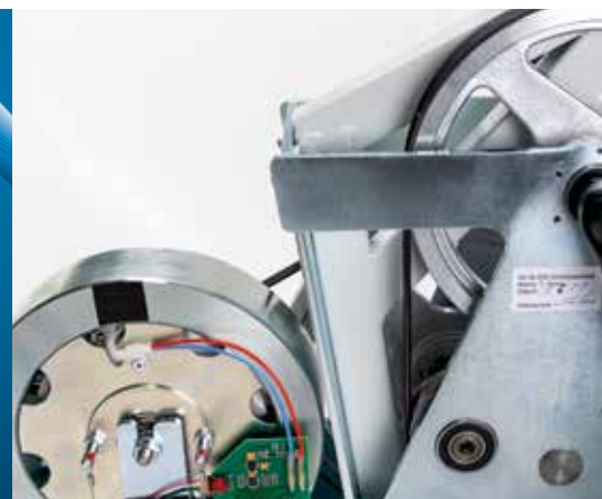
En el interior: masa giratoria óptima y transmisión por correa

Los ergómetros ERG 910 plus y ERG 911 plus se han desarrollado para su uso en el sector de cardiología. Son muy estables gracias a su estructura de tubos de acero. Son por ello adecuados para pacientes de hasta 160 kg de peso, o incluso para pacientes de hasta 200 kg si se incorpora el estabilizador (opcional). Las unidades son compactas y ocupan un espacio de suelo mínimo.