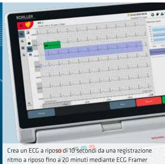
Crea un ECG a riposo di 10 secondi da una registrazione ritmo a riposo fino a 20 minuti mediante ECG Framer