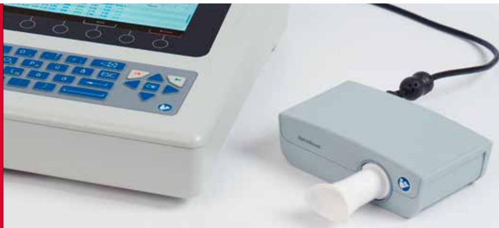
SpiroScout SP plus, pour les tests de spirométrie avec le CARDIOVIT AT-102 G2